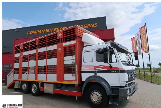
Mercedes-Benz SK 1831 SK 1831