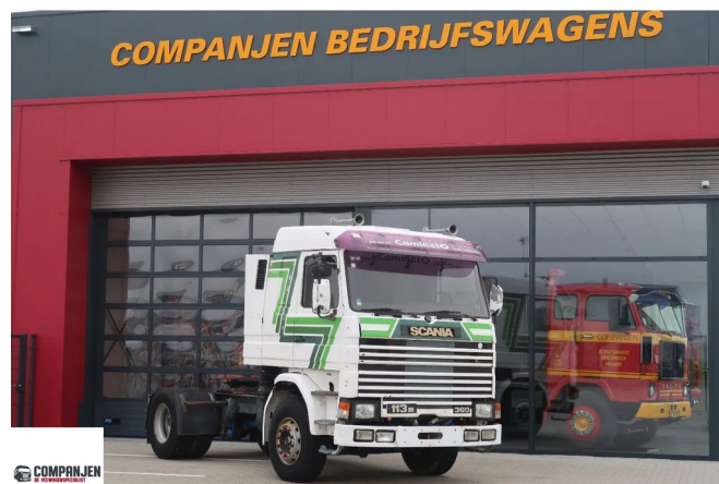
Scania R113-360 113M-360 Runs Like New- 1999