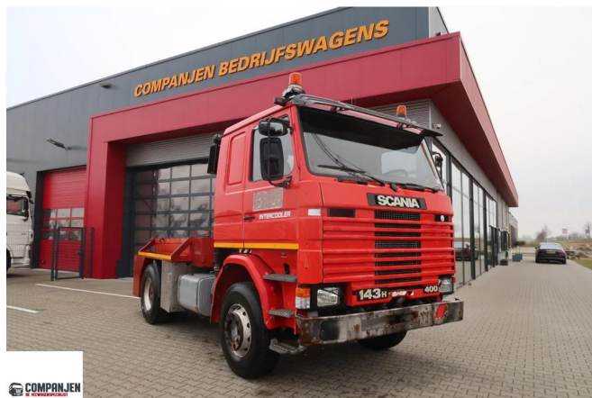
Scania R143-400 V8 143-400