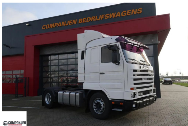
Scania R143-420 V8 143-420