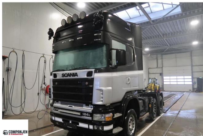
Scania R164-480 V8 R164-480 V8 - Topline - King of the Road - Reta... 6x2