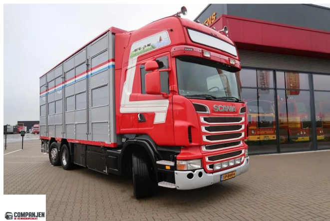
Scania R500 V8 R 500 - Livestock transport - 2006 - Retarder - Gere... 6x2