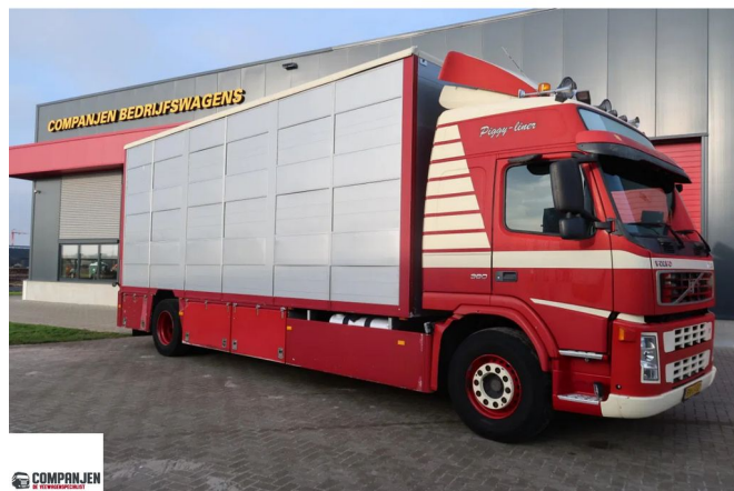
Volvo FM FM 9 -380