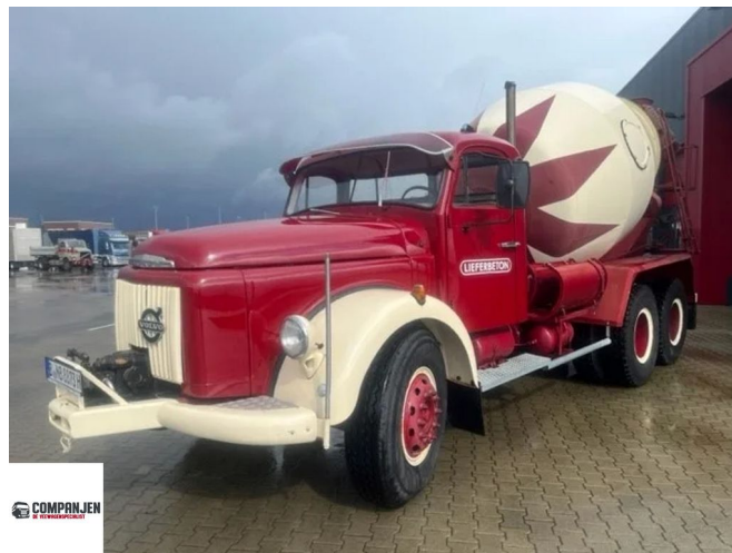
Volvo N N88 - 1973 - Concrete mixer - Oldtimer