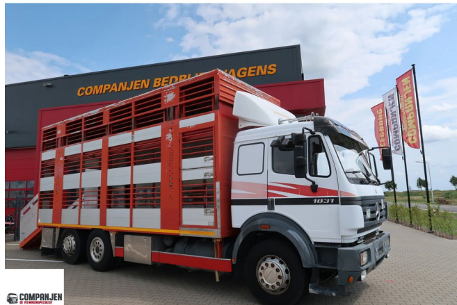
Mercedes-Benz SK 1831 SK 1831