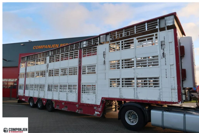
Pezzaioni SBA 31 - Cattle Transport