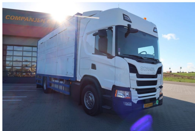
Scania G450 NGS G