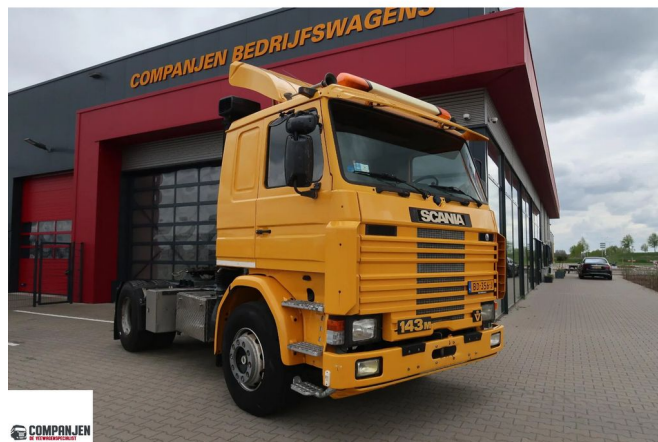
Scania R 143 MA 4X2 143 M