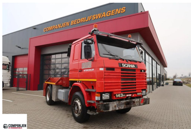
Scania R143-400 V8 143-400