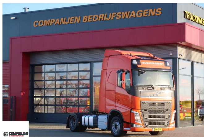
Volvo FH FH 420

• ABS • Aire acondicionado • Asientos con suspensión neumática • Cabina de dormir • Caja de herramientas • Cierre central de puertas • Control de estabilidad • Cruise control • Doble Tanque de combustible • Espejos calefactables • Freno de motor reforzado • Limitador de velocidad • Luces brillantes • Luces de niebla • Nevera • Parasol • Radio / reproductor de CD • Spoiler para el techo • Tanque de combustible de aluminio • Ventanas electrónicas