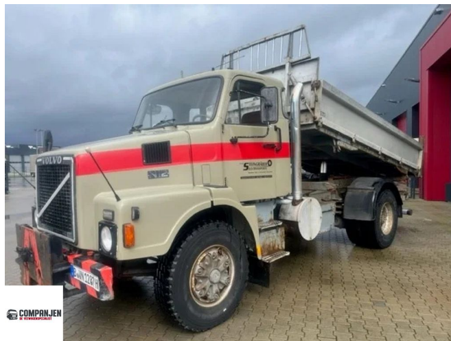
Volvo N 12 N12 - 1987 - Tipper - Oldtimer