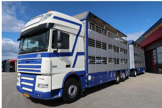
DAF XF 105 105-460