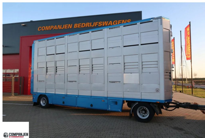
CUPPERS LVA 10-10 AL - Pig transporter