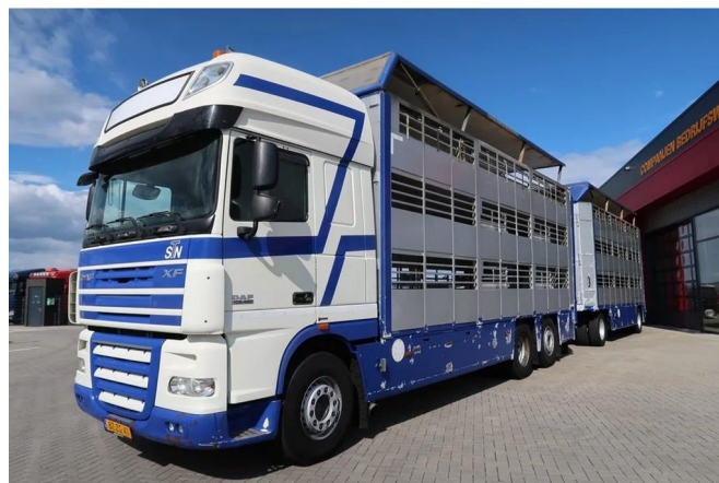
DAF XF 105 105-460