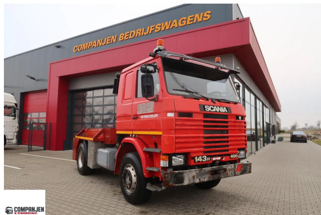
Scania R143-400 V8 143-400