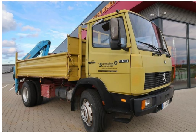
Mercedes-Benz SK 1320