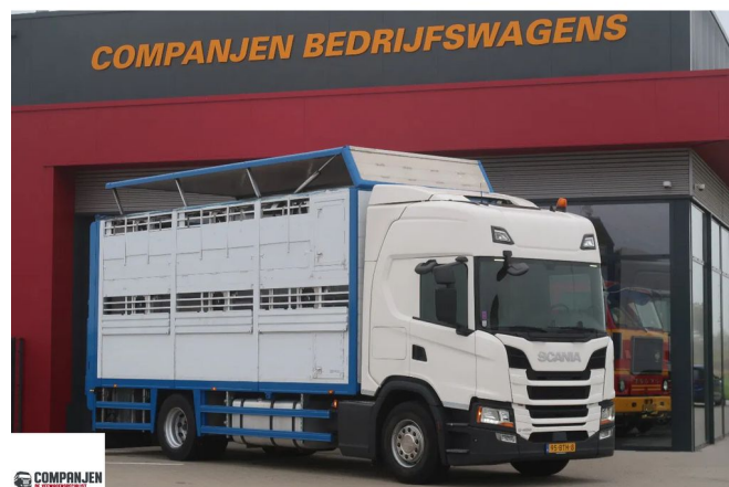
Scania G450 Scania G450 met Cuppers bak - 2017 - Retarder 4x2