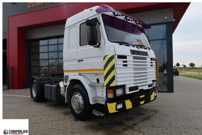
Scania R143-450 V8 143-450 Topline - 1989 - Retarder