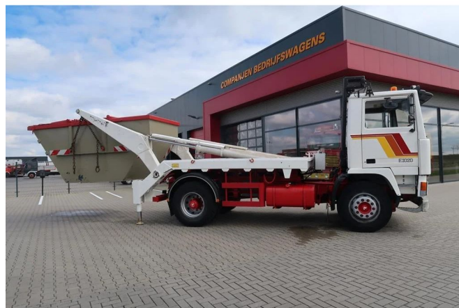
Volvo F 10 F10 4x2