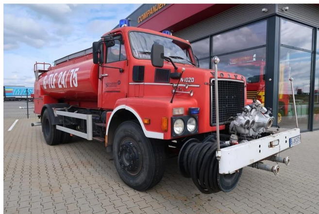
Volvo N 10 N10 4x2